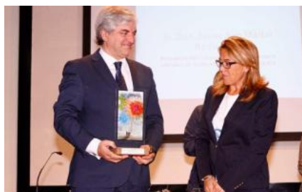
Un momento del acto de clausura del 50 aniversario de la Escuela de Relaciones Laborales.