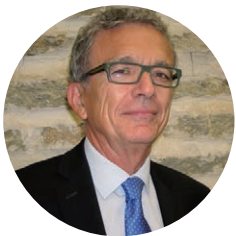
Dirección académica Antonio Sempere Navarro Magistrado del Tribunal Supremo y catedrático de universidad

El Congreso, orientado al networking, será una oportunidad única para compartir conocimientos y dudas sobre las novedades normativas y la aplicación práctica de las últimas reformas con ponentes de primer nivel de la Administración Pública, empresas y despachos de abogados.