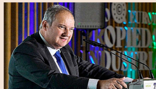
El ministro de Industria, Jordi Hereu, durante el acto de clausura.

Cada una de las mesas contribuyó con sus propios resultados, pero el acto de clausura sirvió para asentar unas conclusiones generales sobre lo