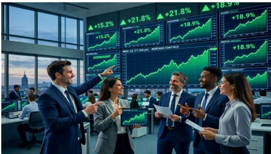
5 acciones con potencial y que encandilan a los mejores bancos de inversión

Distribuido para WHITE RABBIT * Este artículo no puede distribuirse sin el consentimiento expreso del dueño de los derechos de autor.