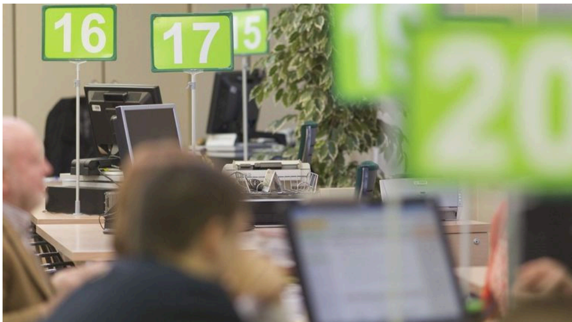
Una oficina de la Seguridad Social.