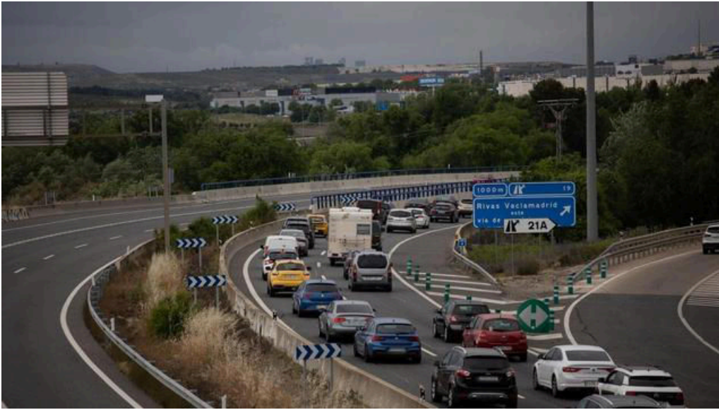
Tráfico en la autovía A3 por la operación retorno del puente