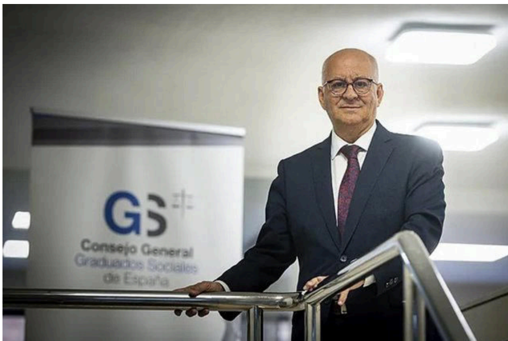
Joaquín Merchán, presidente del Consejo General de Graduados Sociales de España