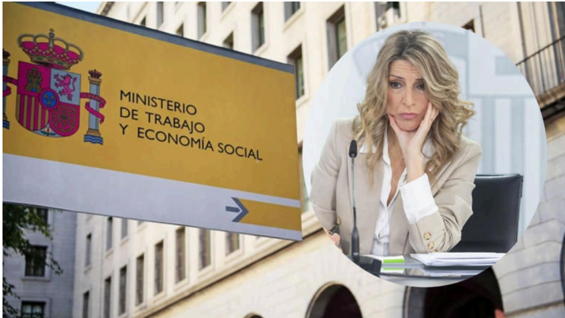
Montaje de Yolanda Díaz, ministra de Trabajo, con la sede del ministerio.