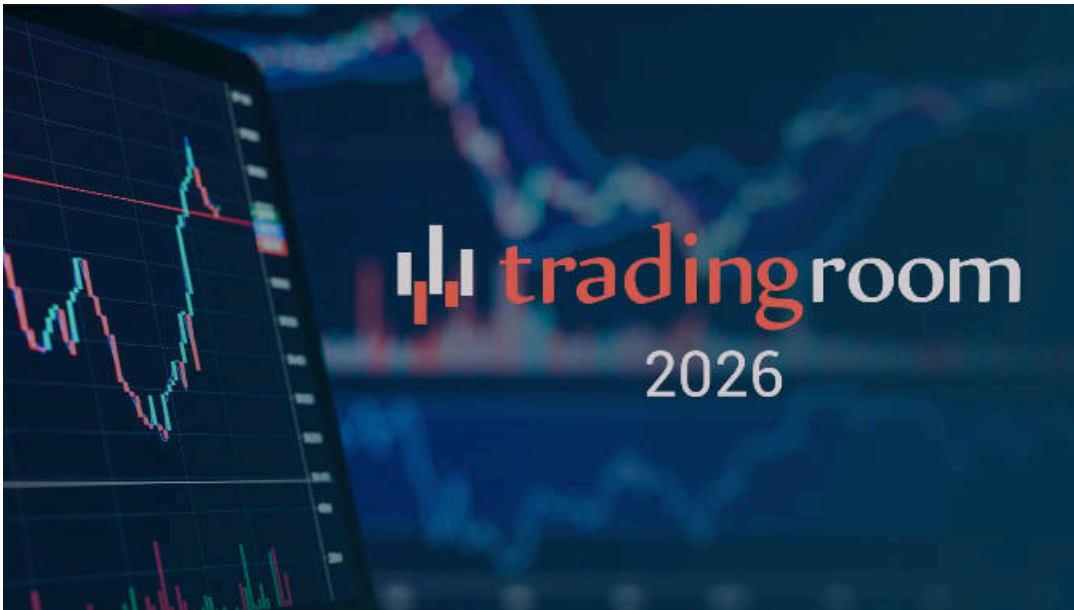
Trading Room 2026: cómo posicionar las carteras ante los grandes cambios del mercado