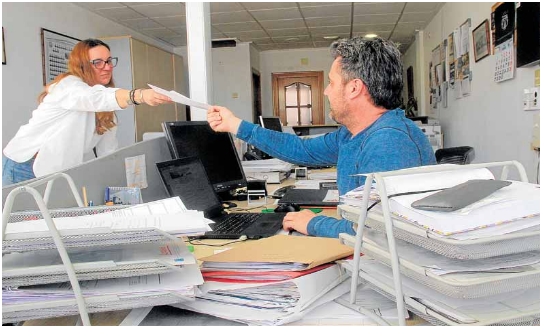
Dos gestores en la asesoría Pedro's SL de Canteras, en Cartagena, ayer.