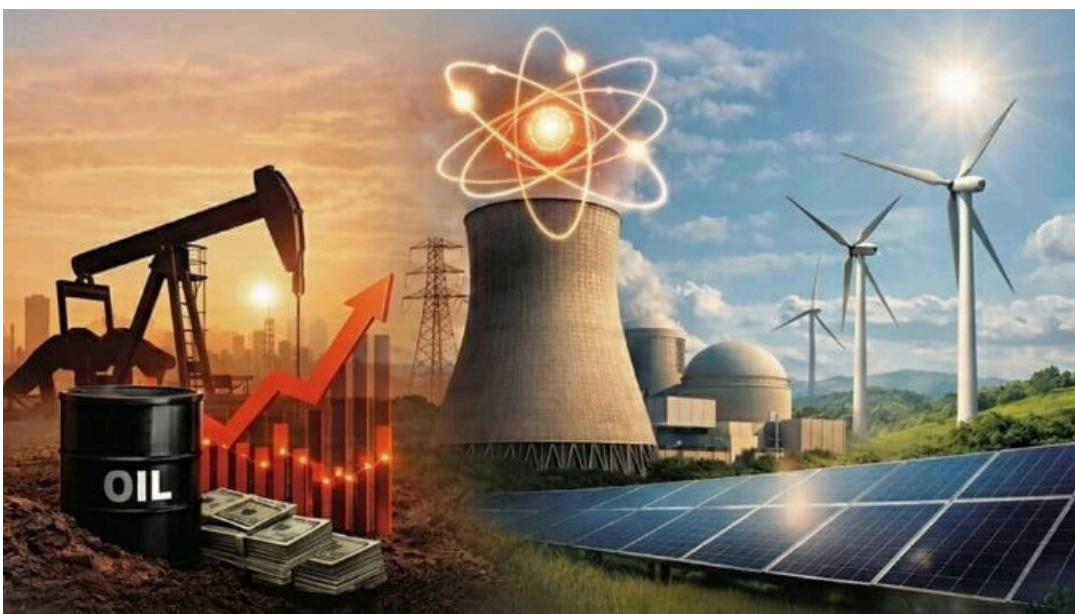
Especial Energía: Del shock del petróleo al auge nuclear: claves del nuevo ciclo energético mundial

Distribuido para WHITE RABBIT * Este artículo no puede distribuirse sin el consentimiento expreso del dueño de los derechos de autor.