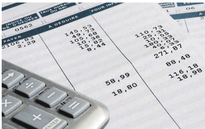
Los graduados sociales denuncian el caos que ha provocado la orden de bases de cotización.

La Seguridad Social determina cada año el importe de las bases máximas y mínimas, y los diferentes tramos sobre los que se aplican los porcentajes para determinar la cotización que deben