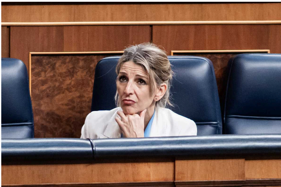
La vicepresidenta segunda y ministra de Trabajo y Economía Social, Yolanda Díaz.

El Boletín Oficial del Estado (BOE) confirma que las empresas deben rehacer las nóminas del primer trimestre de 2026. La publicación de la nueva orden de cotización tiene efectos retroactivos desde enero. Esta situación genera un colapso administrativo que afecta a millones de trabajadores y miles de departamentos de recursos humanos.