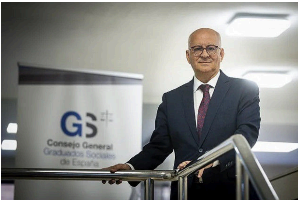
Archivo - Joaquín Merchán, presidente del Consejo General de Graduados Sociales de España

El Consejo General de Graduados Sociales ha exigido que la Seguridad Social regularice de oficio las cotizaciones a la Seguridad Social de marzo tras publicarse la Orden de Cotización de 2026 el último día de marzo, tres meses después de que se iniciara el año.