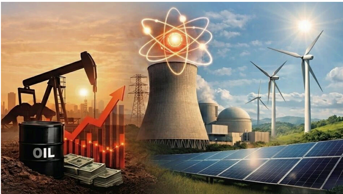
Especial Energía: Del shock del petróleo al auge nuclear: claves del nuevo ciclo energético mundial