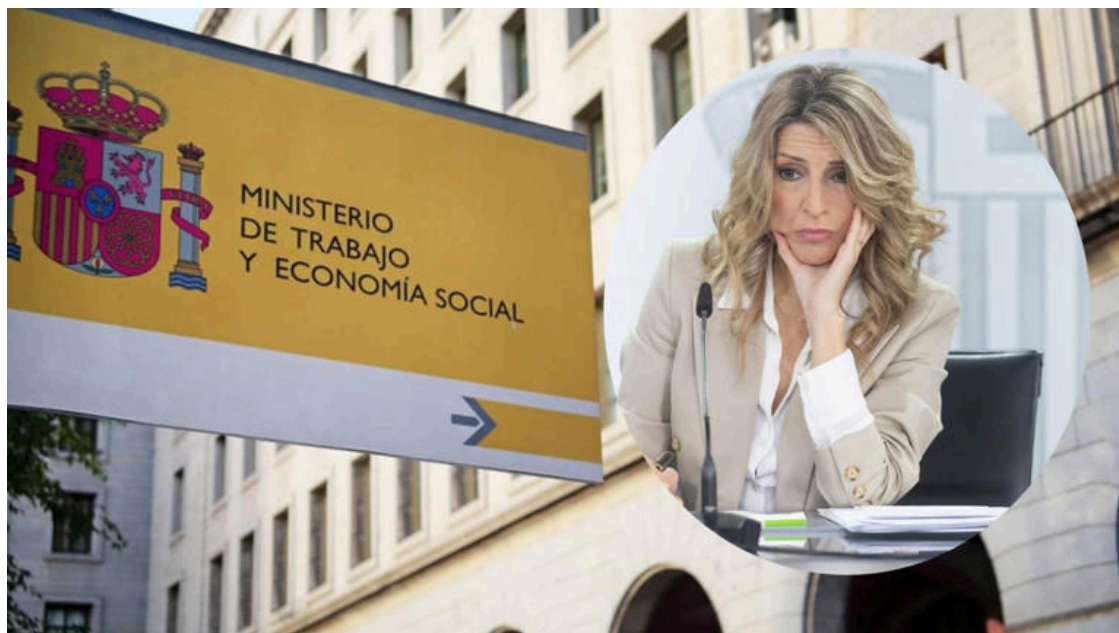
Montaje de Yolanda Díaz, ministra de Trabajo, con la sede del ministerio.

Otro de los dispositivos que ha utilizado la DGT son los llamados 'radares invisibles' o veloláser, unos aparatos de unos 50 centímetros de alto que se coloca en los guardarraíles de las carreteras, lo que los hacen prácticamente indetectables e incluyen las últimas novedades en conexión WiFi, por lo que se pueden controlar a distancia. Son capaces de detectar infracciones y excesos de velocidad independientemente del sentido de la marcha. Es un aparato que puede instalarse en cualquiera de los vehículos policiales, en un trípode o acoplados de forma magnética y ocultos en los guardarraíles. Utilizan tecnología láser, son inalámbricos y de pequeño tamaño. Es uno de los más complicados de detectar y actúan tanto de noche como de día en ambos sentidos a la vez.