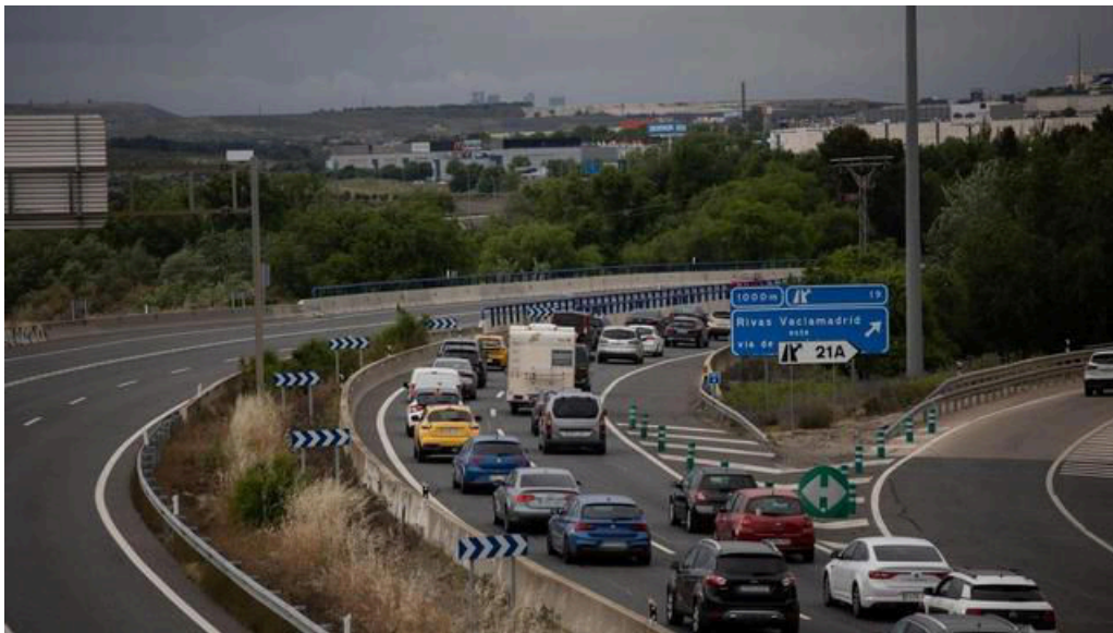
Tráfico en la autovía A3 por la operación retorno del puente

La entrada a las grandes capitales como Madrid, Barcelona, Valencia, Murcia, Málaga, Sevilla, Zaragoza y Murcia está registrando complicaciones en la circulación, coincidiendo con la última jornada de la operación retorno de Semana Santa, según ha informado la Dirección General de Tráfico (DGT).