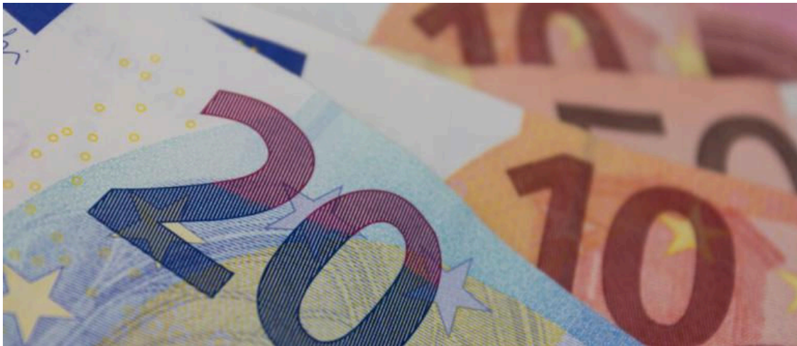
Cotización a la seguridad social de los graduados sociales_img

En un comunicado, los graduados sociales han afirmado que la Seguridad Social se ha comprometido a regularizar de oficio las cotizaciones de enero y febrero, una medida anunciada a través del Boletín RED 2026/05, pero las cotizaciones de marzo, que deben pagarse en abril, quedan fuera de esa regularización automática a pesar de que el presidente del Consejo General de Graduados Sociales de España, Joaquín Merchán , lo ha pedido expresamente.